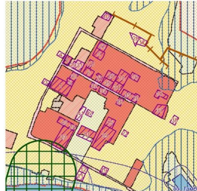
Фрагмент с отображением зоны охраны объектов культурного наследия