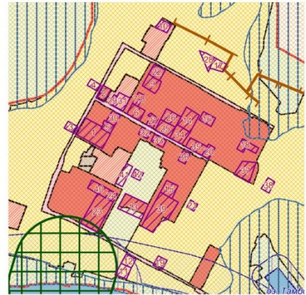
Фрагмент с отображением зоны охраны объектов культурного наследия