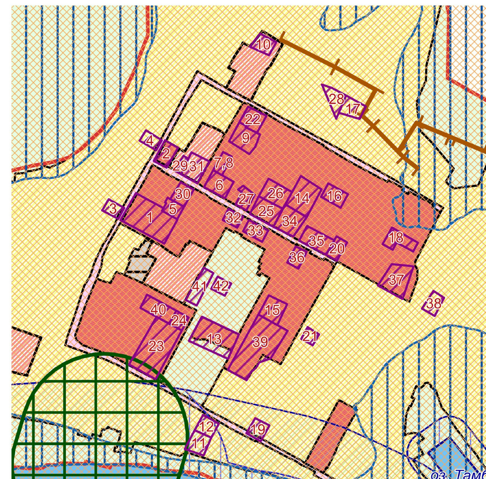
Фрагмент с отображением зоны охраны объектов культурного наследия